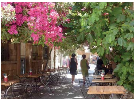
Musarder au village d'Égine