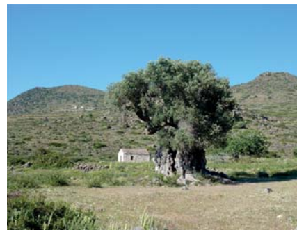
La vallée des oliviers