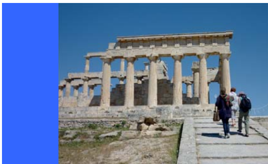
Le magnifique temple d'Aphaia

Le jeudi est libre ; c'est l'occasion de s'octroyer une vraie pause, de visiter l'île, de marcher ou d'aller à la plage, une bonne manière de ressourcer son inspiration. Nous aurons le temps d'en reparler.