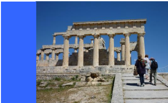
Le magnifique temple d'Aphaia

C'est l'occasion de s'octroyer une vraie pause, de visiter l'île, de marcher ou d'aller à la plage, une bonne manière de ressourcer son inspiration. Nous aurons le temps d'en reparler.