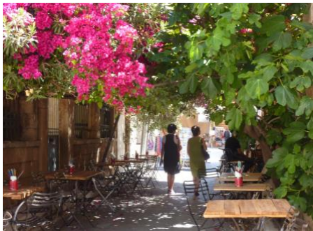
Musarder au village d'Égine