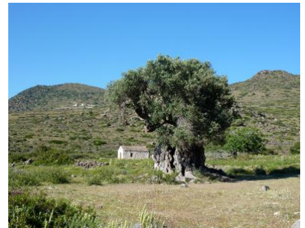
La vallée des oliviers